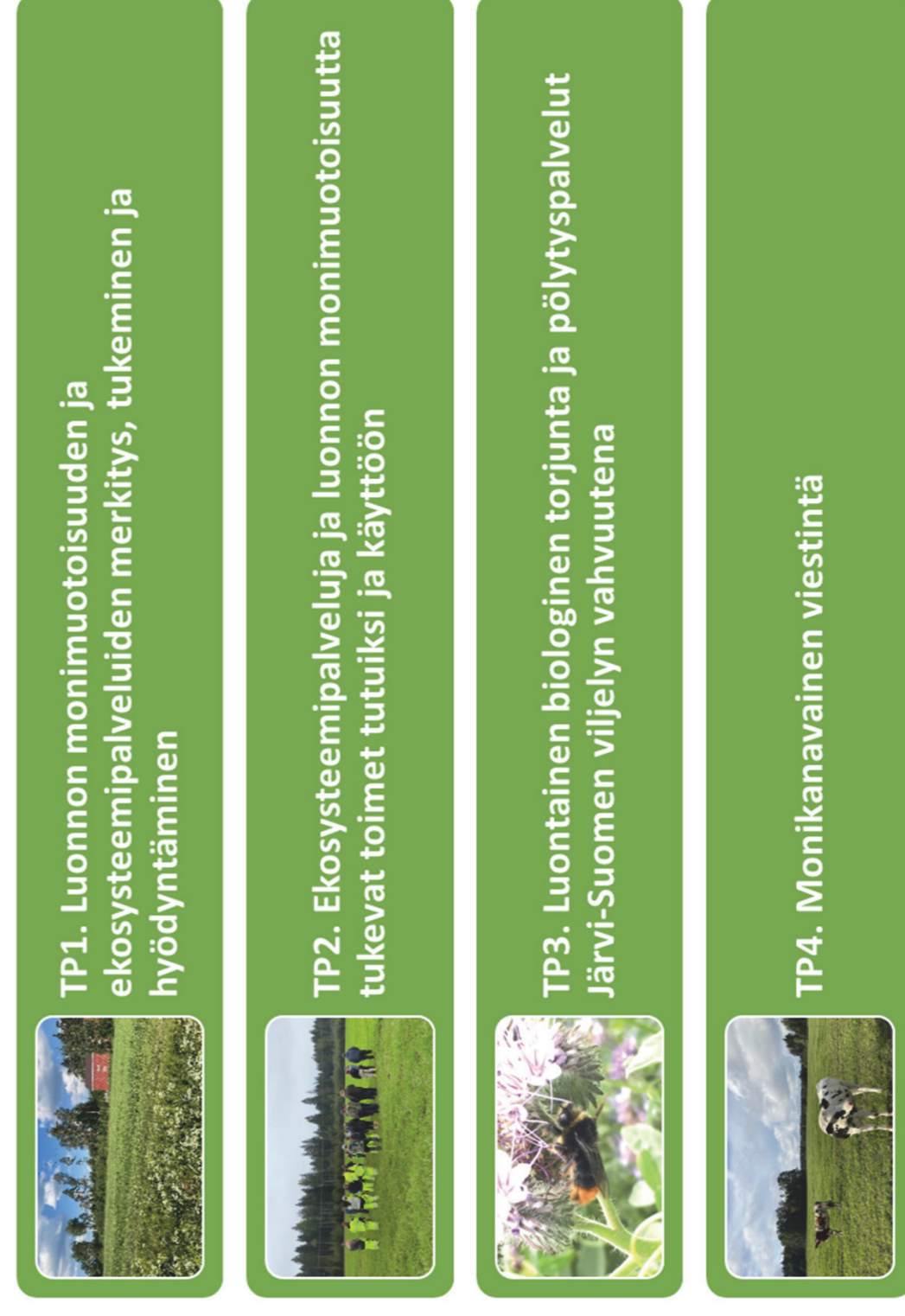
Kuva 3. ARVO-hankkeen työpaketit ja toteutusalue.

Hankkeessa tuodaan esiin Järvi-Suomen erityispiirteitä ja ekosysteemipalveluja, aktivoimaan toimintaa, järjestetään peltopäiviä ja demoja sekä tuotetaan tietomateriaalia monikanavaisen viestintään (Kuva 3).