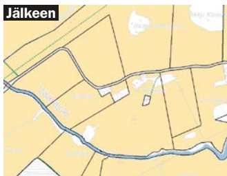
Tilusjärjestelyillä voidaan huomattavasti parantaa alueen tilojen tilusrakennetta.

S uomen pirstoutunut peltotilusrakenne heikentää maatalouselinkeinojen kannattavuutta. Huono tilusrakenne yhdessä maatalouden rakennemuutoksen kanssa on johtanut kasvua hakevien tilojen kannalta epäedulliseen kilpailutilanteeseen. Tämä vaikuttaa koko ruokaketjun kannattavuuteen.